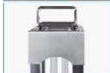
Дръжка за пренасяне