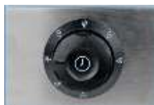
Контролен панел & Таймер